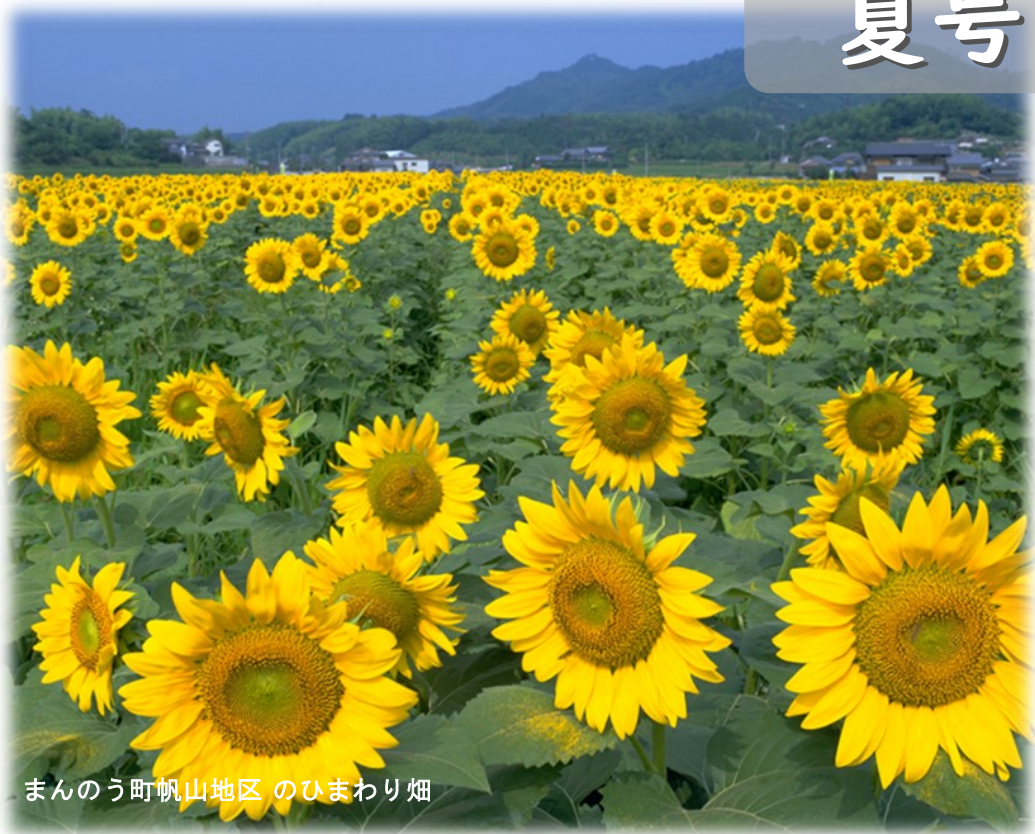
まんのう町帆山地区のひまわり畑